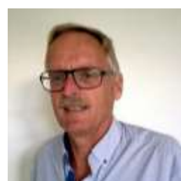
A. Krist lid werknemers