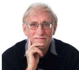
drs. F. Mentjox lid werkgevers v.a. 1-8-2018