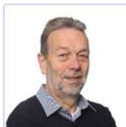
J. Damen lid werknemers