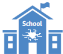
Klassieke brede school