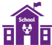
Netwerk in de buurt